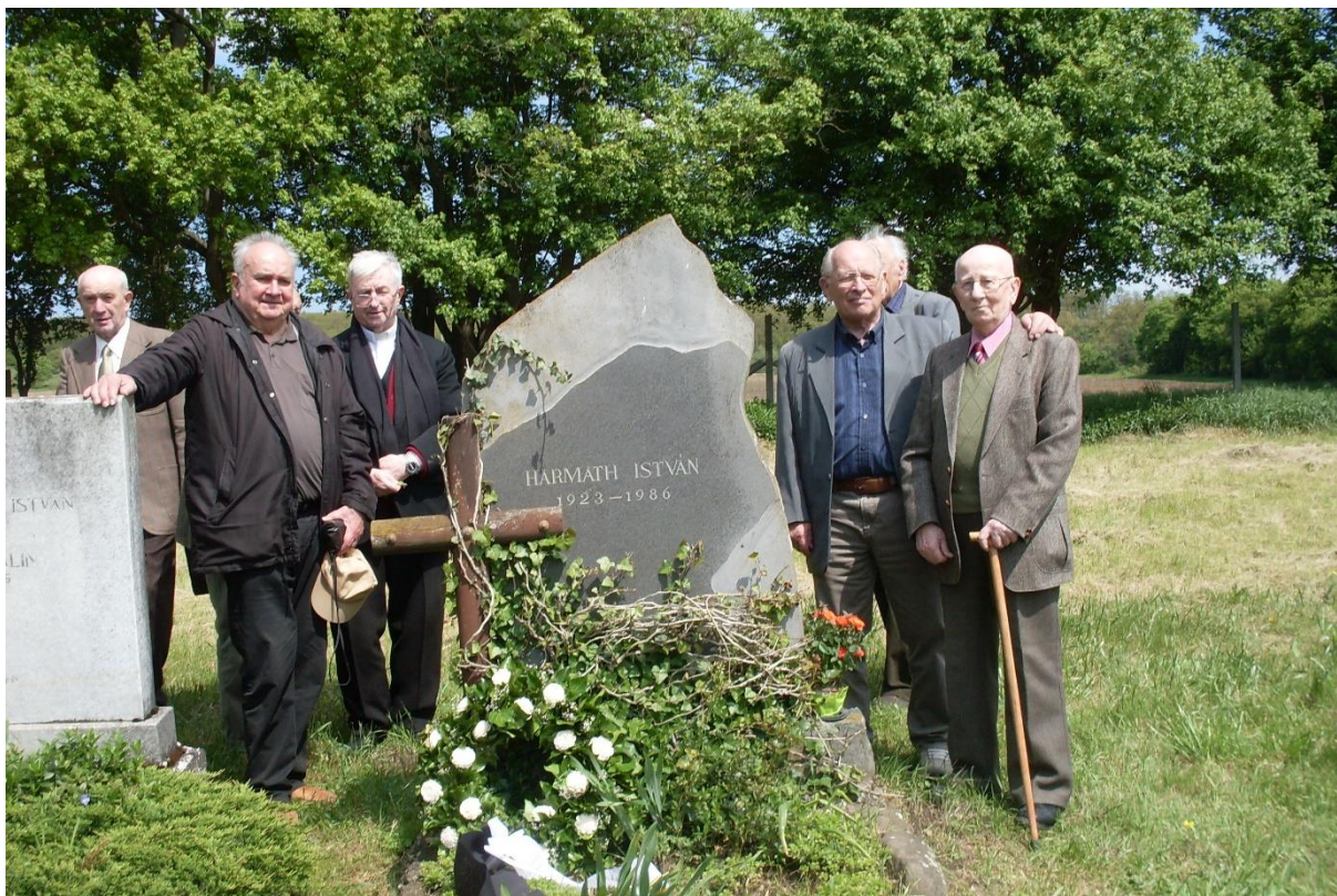
1954-ben érettségizett öregdiákok