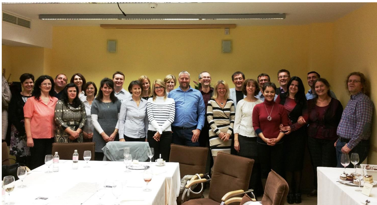
1991-ben végzett 4.E osztály