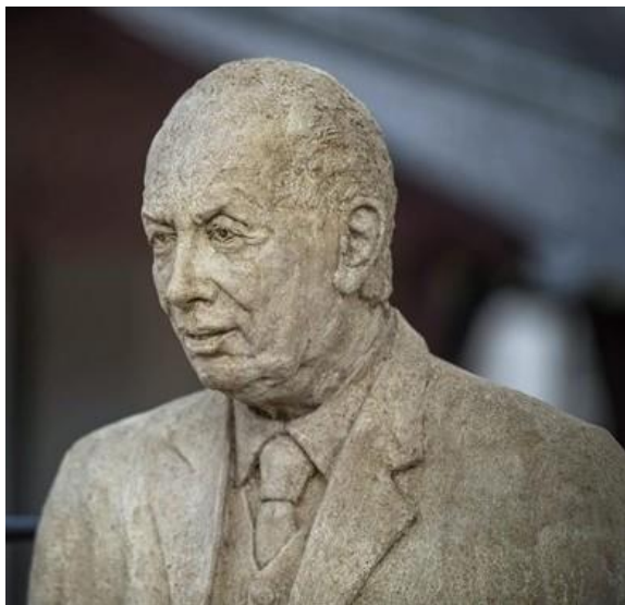
Gács Barna szobra

Mádl Ferenc 1951-ben végzett az államosított piarista gimnáziumban.