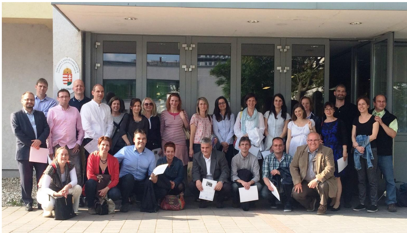
1991-ben végzett 4.C osztály