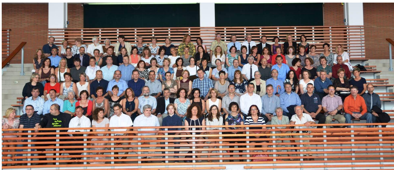
A tornacsarnokban együtt az egész 1986-os évfolyam, tanárainkkal