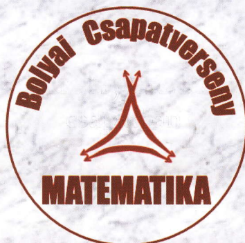
Tassy Gergely szervező