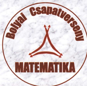
Tassy Gergely szervező